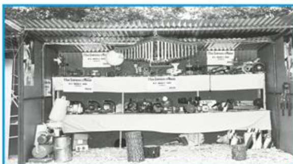
1974 - Tipico stand di legno e lamiera