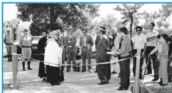
1974 - Si inaugura la prima fiera campionaria

E qui inizia la storia della fiera di Morcone, la prima sorta nella Regione Campania.